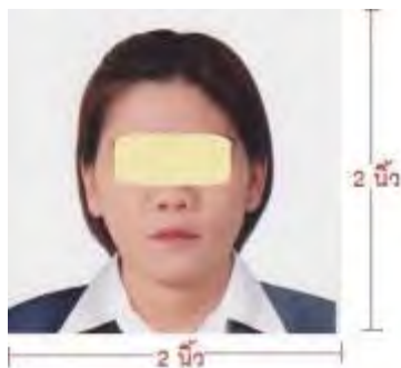
รูปถ่ายยื่นวีซ่า

หนังสือเดินทางของท่าน จะถูกส่งคืนมาที่บ้านท่านทางไปรษณีย์ ตามที่อยู่ทีกรอกในแบบฟอร์มไว้