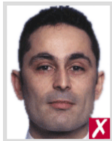
ไกลเกินไป