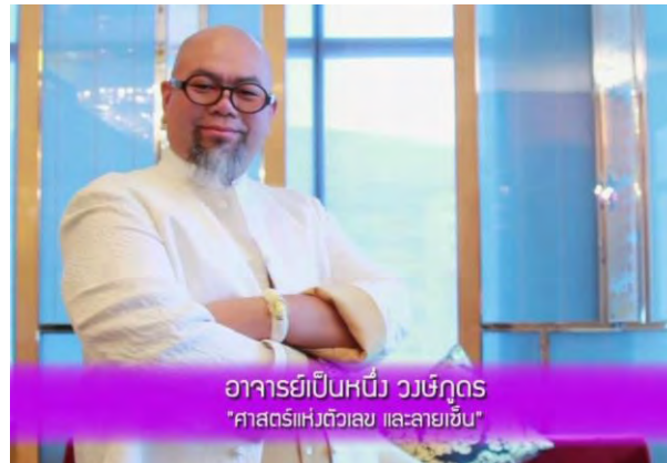
อาจารย์เป็นหนึ่ง วงษ์กุด "ศาสตร์แห่งตัวเลข และลายเซ็น"