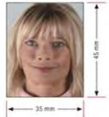
รูปถ่ายมาตรฐาน

2. รูปถ่าย รูปถ่ายสี ขนาดตรงขนาด 35mm.x 45mm. ใบหน้า 90 เปอร์เซ็นต์ของพื้นที่รูปถ่าย จำนวน 2 ใบ ห้ามตกแต่งรูป ถ่ายจากร้านถ่ายรูปเท่านั้น ห้ามสวมแว่นตา หรือเครื่องประดับ , ต้องไม่เป็นรูปสติ๊กเกอร์ **แนะนำให้ลูกค้าไปถ่ายในสถานทูต 180 บาท จำนวน 4 รูปนะคะ หากจำเป็น**