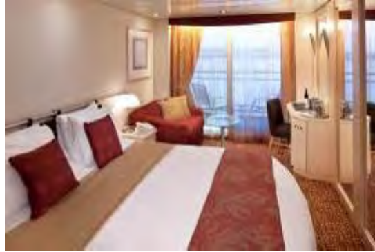
Ocean view cabin (ห้องพักแบบหน้าต่าง)